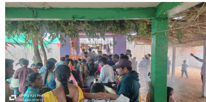
జాతరలో హెల్త్ క్యాంపు