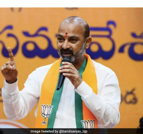
ఉండాలా.. వెనుకబడ్డ ఆదిలాబాద్, పాలమూరు జిల్లాలకు సీట్లు పెంచాలని అవసరమే లేదా అని నిలదీశారు. మీ హైబ్రిడ్ మోడల్ అంటే ఇదేనా అని

డిలిమిటేషన్, మహిళా రిజర్వేషన్ బిల్లులతో జరిగే నష్టమేమిటో చెప్పే దమ్ములేక రాజకీయం చేయాలనుకుంటున్నారా అని సీఎం రేవంత్ రెడ్డిని కేంద్రమంత్రి బండి సంజయ్ ప్రశ్నించారు. డిలిమిటేషన్లో భాగంగా ప్రతి రాష్ట్రాని 50 శాతం సీట్ల పెంచితే దక్షిణాదికి జరిగే నష్టమేంటని.. ప్రజల్లో లేనిపోని భయాందోళనలు స్రుష్టించి విభజించాలనుకుంటున్నారా అని నిలదీశారు. అసలు.. మీరు చెప్పే శాస్త్రీయత ఏమిటి..? డబ్బు సమకూర్చే వాళ్లకి ప్రాధాన్యత ఇవ్వాలని చెబుతున్నారా అని ప్రశ్నించారు. డబ్బుకు, ఓటుకు, సీటుకు లింకు పెడతారా..? లక్ష కోట్లు ఉన్న మీ కుటుంబానికి లక్ష ఓట్లు ఇవ్వాలా..? డబ్బులేని పేదవాడికి ఓటు హక్కు కల్పించాడా అని ప్రశ్నల వర్షం కురిపించారు. ముంబయికి, ఢిల్లీకి మాత్రమే అత్యధిక సీట్లు