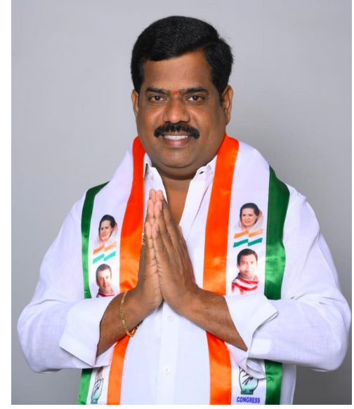
గుర్తు చేశారు. ముఖ్యంగా రెడ్డి సామాజిక వర్గం నుండి ప్రస్తుతం ఎవరూ పెద్ద ఎత్తున రాజకీయంగా మున్సిపాలిటీలో లేకపోవడంతో రెడ్డి కోటలో తనకు

ఇచ్చిన హామీ అభిప్రాయం నిలబెట్టుకుంటుందని భరోసా.. మున్సిపల్ ఎన్నికల్లో నాలుగు వార్డుల్లో తనదైన చాతుర్యం.. రెడ్డి సామాజిక వర్గం నుంచి తనకే అవకాశం ఉందని స్పష్టీకరణ..