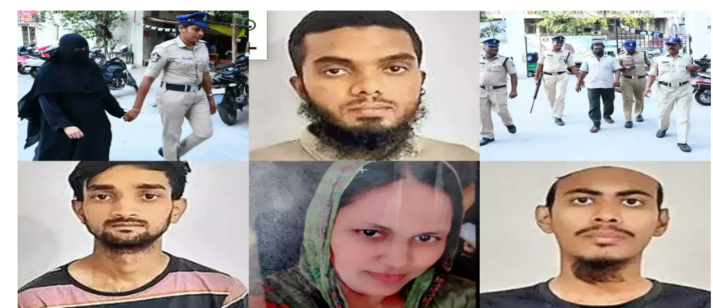
కురిపించారు. కస్టడీ గడువు ముగియడంతో, పోలీసులు నిందితులను వైద్య పరీక్షల అనంతరం విజయవాడ కోర్టులో హాజరుపరిచారు. నిందితుల నుంచి సేకరించిన ప్రాథమిక ఆధారాలను, విచారణ నివేదికను పోలీసులు న్యాయమూర్తికి సమర్పించారు. పోలీసుల వాదనలను విన్న న్యాయస్థానం,

ఆంధ్రప్రదేశ్ లో కలకలం రేపిన ఉగ్రవాద సంబంధాల కేసులో ఆరుగురు నిందితుల పోలీస్ కస్టడీ సోమవారం ముగిసింది. గత ఐదు రోజులుగా పోలీసుల విచారణలో ఉన్న నిందితులను అధికారులు క్షుణ్ణంగా ప్రశ్నించి, కీలక సమాచారాన్ని సేకరించినట్లు సమాచారం. నిందితులను ఐదు రోజుల పాటు ప్రత్యేక బృందాలు విచారించాయి. ఈ విచారణలో ప్రధానంగా సోషల్ మీడియా ప్లాట్ ఫామ్స్ ద్వారా ఉగ్రవాద భావజాలాన్ని ఎలా వ్యాప్తి చేస్తున్నారు? ఎవరెవరిని సంప్రదిస్తున్నారు? అనే అంశాలపై ఆరా తీసినట్లు తెలుస్తోంది. ఈ కార్యకలాపాలకు నిధులు ఎక్కడి నుండి అందుతున్నాయి? విదేశీ లింకులు ఏవైనా ఉన్నాయి? అనే కోణంలో విచారణ సాగినట్లు సమాచారం. వారి తదుపరి ప్రణాళికలు ఏమిటి? రాష్ట్రంలో ఏవైనా విచ్చిన్నకర చర్యలకు ఎ-ఓ-ఓ-ఓ చేశారా? అన్న విషయాలపై పోలీసులు ప్రశ్నలు