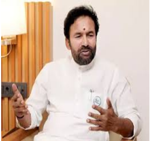
మీద ఈ కుటుంబ పీఠే ప్రయత్నం కాంగ్రెస్ నేతలు చేస్తున్నారని ఎద్దేవా చేశారు. 70 కోట్ల మంది మహిళల గౌరవాన్ని పెంచాలని.. వారికి హక్కులు కల్పించాలని రిజర్వేషన్లు తీసుకువస్తున్నామని

మహిళా రిజర్వేషన్లపై సీఎం రేవంత్ రెడ్డి అవగాహన లేవంతో మాట్లాడుతున్నారని కేంద్రమంత్రి కిషన్ రెడ్డి తెలిపారు. 15, 16, 17 తేదీల్లో పార్లమెంట్ లో జరిగే చర్చలో అందరూ ఎంపిలు మాట్లాడవచ్చని వెల్లడించారు. మహిళలకు చట్టసభల్లో రిజర్వేషన్లు కల్పించాలని ప్రధానమంత్రి నరేంద్ర మోదీ ఈ నిర్ణయం తీసుకున్నారని వివరించారు. మహిళా రిజర్వేషన్లపై రాజకీయాలు చేయొద్దని కాంగ్రెస్ ని కోరారు. ప్రధానమంత్రి నరేంద్రమోదీకి మహిళా రిజర్వేషన్లు, డిలిమిటేషన్లపై సీఎం రేవంత్ రెడ్డి చేసిన ఎక్స్ పోస్ట్ పై కేంద్రమంత్రి కిషన్ రెడ్డి స్పందించారు. దశాబ్దాలుగా కాంగ్రెస్ పరిపాలన చేసింది.. అంబేద్కర్ చెప్పిన మహిళల రిజర్వేషన్ల గురించి ఎందుకు పట్టించుకో లేదని కిషన్ రెడ్డి ప్రశ్నించారు. ప్రధానమంత్రి నరేంద్ర మోదీ మహిళలకు రిజర్వేషన్లు తీసుకువస్తుంటే కోడి గుడ్డు