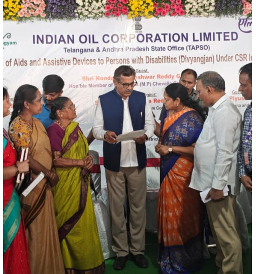
నిర్వహణ చేపడతామని ఎంపీ హామీ ఇచ్చారు. అదేవిధంగా ఎంపీ సూచనలతో వెటర్నరీ క్లినిక్ కి

టాయిలెట్స్ నిర్మించాలని ప్రభుత్వ కార్యాలయాల్లో త్రాగునీటి వనతినీ కల్పించాలని కోరన రంగారెడ్డి జిల్లా గెజిటెడ్ అధికారుల సంఘం తెలంగాణ గెజిటెడ్ అధికారుల సంఘము, రంగారెడ్డి జిల్లా అధ్యక్షులతో కొండ విశ్వేశ్వర్ రెడ్డి, చేవెళ్ల ఎంపీ కి వివిధ అంశాలపై వినతి పత్రం అందజేయడం జరిగింది.శంషాబాద్ మండలానికి ఒక కార్యక్రమానికి విచ్చేసిన ఎంపీ కొండ విశ్వేశ్వర్ రెడ్డి కి పలు అంశాలతో కూడిన వినతి పత్రం అనగా మహిళలు పనిచేసే సేవెళ్ల పార్లమెంటులో నియోజకవర్గం పరిధిలోని కార్యాలయాలలో మరుగుదొడ్డు నిర్మాణం కొరకు అలాగే సుమారు 500 ప్రభుత్వ కార్యాలయాల్లో ఆర్.వో వాటర్ ప్యూరిఫైయర్స్ ఏర్పాటు కొరకు వినతి పత్రం సమర్పించడం జరిగింది.చేవెళ్ల పార్లమెంట్ నియోజకవర్గ పరిధిలో ఉన్న ఏడు అసెంబ్లీ నియోజకవర్గాలలో మరుగుదొడ్డు