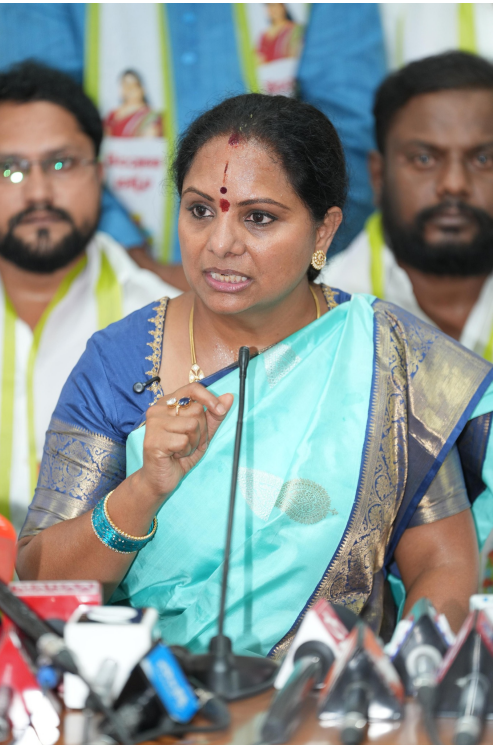
పార్లమెంటులో బయటపెట్టిన తెలిపారు. తమ పార్టీ ఆవిర్భావ సభకు రాష్ట్రం సలుమూల నుంచి తరలివచ్చే క్యాడర్ వాహనాలకు ఎలాంటి ఎలాంటి ఇబ్బంది కలిగించాదని పోలీసులు, అధికార యంత్రాంగాన్ని కోరారు.

ప్రభుత్వానికి లెక్కలేదని అన్నారు. ఆర్టీసీని ప్రైవేటువరం చేసే కుట్రలను అడ్డుకుంటామని హెచ్చరించారు. వెంటనే ఆర్టీసీని ప్రభుత్వంలో విలీనం చేయాలని కవిత డిమాండ్ చేశారు. ప్రజలు ఇబ్బందుల్లో ఉంటే ప్రభుత్వం, ప్రతిపక్షం సభలు పెట్టాలంటూ మండిపడ్డారు. ప్రతిపక్షం ఉద్దేశాలు చెబితే.. ప్రభుత్వం పట్టకథలు చెప్పిందంటూ వ్యాఖ్యానించారు. బీఆర్ఎస్ సభలో బీజేపీపై ఎందుకు మాట్లాడలేదని ప్రశ్నించారు. మహిళా రిజర్వేషన్ గురించి ఎందుకు మాట్లాడలేదని జాగ్రత్త అధ్యక్షురాలు నిలదీశారు. వెయ్యి ఏళ్లైనా బీఆర్ఎస్ మారదని కవిత వ్యాఖ్యానించారు. గుంటనక్క నిన్ను ఢిల్లీ వెళ్లి ఆర్ఎస్ఎస్ పెద్దలను కలిసినారన్నారు. ప్రాజెక్టులో అవినీతి నుంచి బయటపడేందుకు ఆర్ఎస్ఎస్ చర్యలు జరిపారంటూ కవిత ఆరోపించారు. ఈనెల 25న తెలంగాణ రాజకీయాల్లోకి నూతన రాజకీయ శక్తిగా వస్తున్నామని, ప్రజలందరికీ ఈ వేదిక నుంచి అవకాశం వలకుతు న్నామని చెప్పారు. పార్టీ ఆవిర్భావ సభకు సిరిసిల్ల నుంచి పార్టీ కార్యకర్తలు మంగళవారం