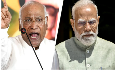
దుర్నియోగం చేస్తోందని అన్నారు. ఆ సందర్భంలోనే తాను మాట్లాడానని, మోదీని టెర్రరిస్టు అని తాను అనలేదని చెప్పారు. ప్రభుత్వం దర్యాప్తు సంస్థలతో ప్రజలను భయభ్రాంతులకు గురిచేస్తోందని చెప్పడమే తన ఉద్దేశమని వివరించారు. కాంగ్రెస్, డిఎంకే కూటమి సాగించిన ప్రచారంపై మీడియా అడిగినప్పుడు, చాలాభాగా జరిగిందని, అన్ని చోట్ల నుంచి అందుతున్న సమాచారం ప్రకారం తమ కూటమి మరోసారి ప్రభుత్వాన్ని ఏర్పాటు చేయడం ఖాయమని ఖర్చే సమాధానమిచ్చారు. రాహుల్ గాంధీ, స్థానిక ఒక వేదిక నుంచి ప్రచారం సాగించకపోవడంపై అడిగినప్పుడు, ఆ విధంగా చూడకూడదని, ప్రతి ఒక్కరూ షానింగ్ ప్రకారమే ప్రచారం చేస్తుంటారని చెప్పారు. 'నేను ఒకచోట నుంచి ప్రచారం చేస్తే, రాహుల్ మరో చోట ఉంటారు. ఎవరు

చెన్నై, ఏప్రిల్ 21 (ప్రజా వినికెడి): కాంగ్రెస్ అధ్యక్షుడు మల్లికార్జున ఖర్చే వివరంలో చిక్కుకున్నారు. తమిళనాడు అసెంబ్లీ ఎన్నికల ప్రచారంలో భాగంగా మంగళవారం చెన్నైలో మాట్లాడుతూ.. ప్రధాని మోదీని ఉద్దేశించి చేసిన వ్యాఖ్యలు వివాదాస్పదమయ్యాయి. దాంతో ఆయన క్షమాపణలు చెప్పాలంటూ భాజపా డిమాండ్ చేసింది అన్నాడిఎంకే-భాజపా పొత్తును ప్రశ్నించి ఖర్చే.. ఆ పార్టీ మోడీతో ఎలా చేతులు కలిపిందన్నారు. ఈ సందర్భంగా ప్రధానమంత్రిని 'టెర్రరిస్టు'గా అభివర్ణించారు. ఆయనకు సమానత్వం, న్యాయంపై నమ్మకం లేవన్నారు. అలాంటి వాళ్లతో అన్నాడిఎంకే కలవడమంటే ప్రజాస్వామ్యాన్ని బలహీనపరచడమే నని విమర్శించారు. తమిళనాడు అసెంబ్లీ ఎన్నికల ప్రచారం చివరిలోనే మంగళవారంనాడు ఖర్చే ఈ వ్యాఖ్యలు చేశారు. కాగా, ప్రచార సభలో చేసిన టెర్రరిస్టు వ్యాఖ్యలపై ఖర్చే వివరణ ఇచ్చారు. బీజేపీ ప్రభుత్వం రాజకీయ పార్టీలను, అభ్యర్థులను భయభ్రాంతులకు గురిచేస్తోందని, సీబీఐ, ఈడీ, ఆదాయ పన్ను శాఖ వంటి సంస్థలను