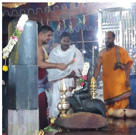
ఫాదర్ నగర్, ప్రజావినికిడి:

అప్పుడు ఈ ప్రాంతంలో పేరు ప్రతిష్ఠలు సంపాదించిన దొరలు ప్రతిష్ఠించిన కోట మైసమ్మ అమ్మవారికి వైభవమైన పూజలు, అన్నింటికి మించి అన్న వితరణ.. ఒక పండుగ వాతావరణంలో ఉత్సవాలు జరిగేవి. కాలక్రమేనా ఆ దొరలు మరణించడంతో ఆలయం బోసిపోయింది.. ఉత్సవాలు ఆగిపోయాయి.. ప్రస్తుతం తిరిగి 150 సంవత్సరాల దివ్యకాంతిని వెలుగులోకి తీసుకొస్తూ వారి వారసుడు రంగంలోకి అడుగుపెట్టారు. అత్యంత వైభవంగా ఉత్సవాలను నిర్వహించి గ్రామానికి కన్నుల పండుగ చేశారు. చుట్టుపక్కల గ్రామాల ప్రజలు కూడా పెద్ద ఎత్తున వచ్చి