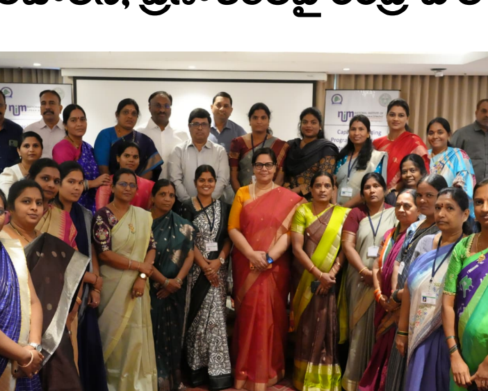
ముఖ్యమని పేర్కొంటూ, పట్టణాభివృద్ధి, పాఠశాలల పాలన, ప్రజలకు మెరుగైన సేవలందించడంలో నాయకత్వ బాధ్యతలను సమర్థంగా నిర్వహించాల్సిన అవసరాన్ని వివరించారు. అదేవిధంగా, విధి విధానాల అమలు, ప్రజలతో అనుసంధానం, డిర్లకాలిక దౌర్జనికతతో ముందుకు సాగాల్సిన అవసరాన్ని స్పష్టం చేశారు. ఏ పని చేసినా మానవీయ కోణంలో పని చేయాలని, ప్రజలకు మంచి చేయాలని ఉంటే చట్టం తప్పకుండా దారి