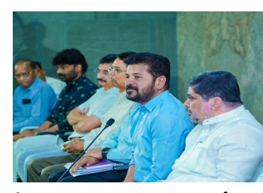
కోసం చొరవ చూపించినందుకు సీఎంకి కార్మిక సంఘాల ప్రతినిధులు ధన్యవాదాలు తెలిపారు. డిమాండ్ల పరిష్కారం కోసం ఇటీవల తెలంగాణ ఆర్టీసీ కార్మికులు సమ్మెకు దిగిన విషయం తెలిసిందే. మూడు రోజుల పాటు సమ్మె చేశారు. దీంతో రంగంలోకి దిగిన ప్రభుత్వం ఆర్టీసీ కార్మికులతో చర్యలు చేపట్టింది. చర్యలు సఫలం కావడంతో ఆర్టీసీ కార్మికులు సమ్మె విరమించారు.