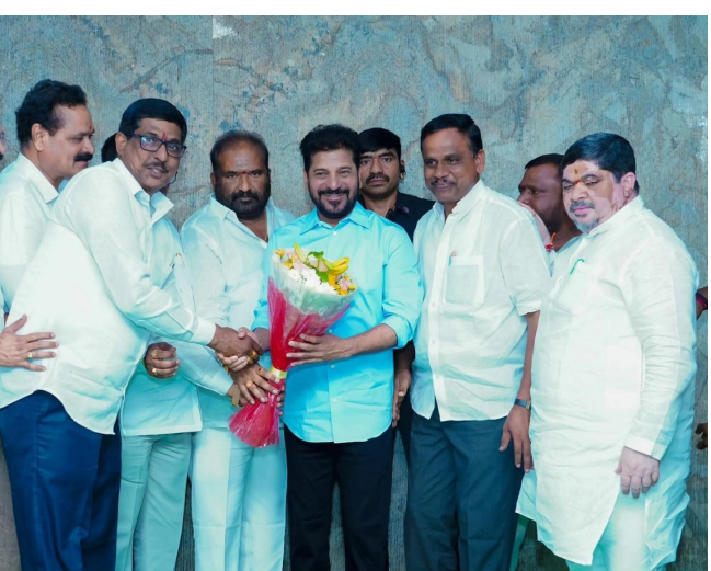
కేసుల ఎత్తివేతకు వెంటనే చర్యలు తీసుకోవాలని మంత్రి పొన్నం ప్రభాకర్, అధికారులను జరిపింది. చర్యలు సఫలం కావడంతో ఆర్టీసీ కార్మికులు సమ్మె విరమించారు.

హైదరాబాద్, మే 1 (ప్రజావినికెడి): రాష్ట్రంలోని ఆర్టీసీ కార్మికులకు సీఎం రేవంత్ రెడ్డి గుడ్ న్యూస్ చెప్పారు. ఆర్టీసీ కార్మికుల 3 రోజుల సమ్మె కాలానికి వేతనాలు ఇవ్వాలని.. అలాగే, సమ్మె కాలంలో పెట్టిన కేసులు ఎత్తివేస్తామని తెలిపారు. శుక్రవారం ముఖ్యమంత్రి రేవంత్ రెడ్డిని జూబ్లీహిల్స్ నివాసంలో ఆర్టీసీ కార్మిక సంఘాల నాయకులు కలిశారు. ఈ సందర్భంగా ఆర్టీసీ కార్మికుల 3 రోజుల సమ్మె కాలానికి వేతనాలు ఇవ్వాలని, సమ్మె కాలంలో పెట్టిన కేసులు ఎత్తివేయాలని కార్మిక సంఘాల ప్రతినిధులు సీఎం రేవంత్ రెడ్డికి విజ్ఞప్తి చేశారు. కార్మిక సంఘాల నేతల అభ్యర్థనపై సీఎం రేవంత్ రెడ్డి సానుకూలంగా స్పందించారు. సమ్మె కాలానికి 3 రోజుల వేతనం ఇచ్చేందుకు, కేసుల ఎత్తివేతకు అంగీకరించారు. ఈ మేరకు సమ్మె కాలంలో వేతనం,