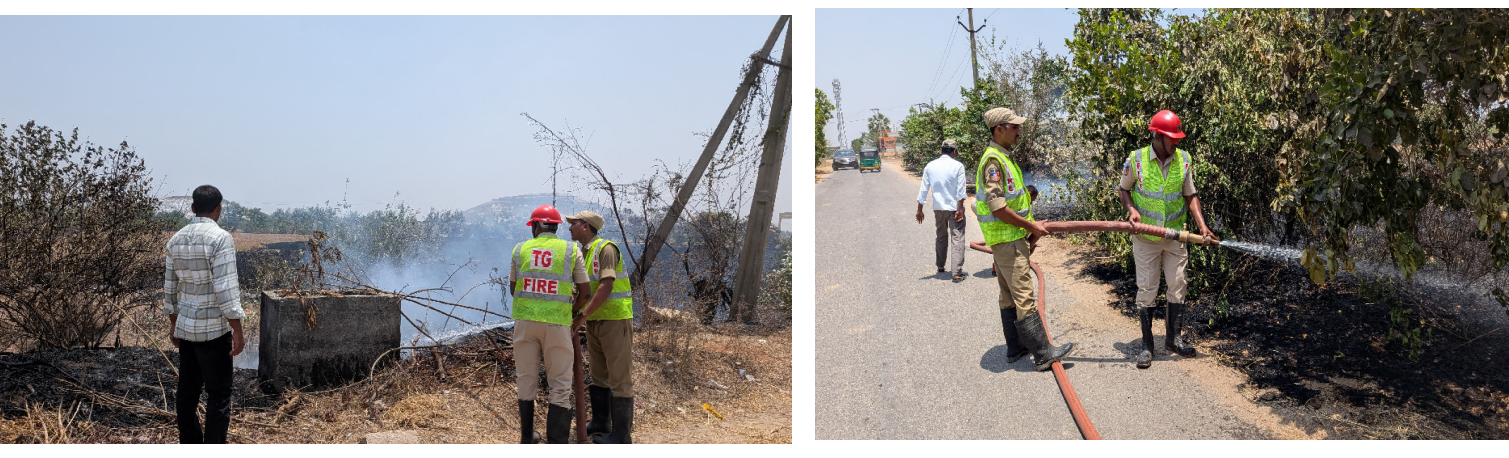
అనంతగిరి.మే 1 (ప్రజావినికెడి):

అనంతగిరి మండల పరిధిలోని అమీనాబాద్ గ్రామంలో విద్యుత్ షార్ట్ సర్క్యూట్ కారణంగా హరితహారం చెట్లకు నిప్పుంటుకున్న ఘటన చోటుచేసుకుంది. గ్రామంలోని ఇందిరమ్మ కాలనీ ప్రధాన రహదారి సమీపంలో ఒక్కసారిగా మంటలు చెలరేగడంతో స్థానికులు భయందోళనకు