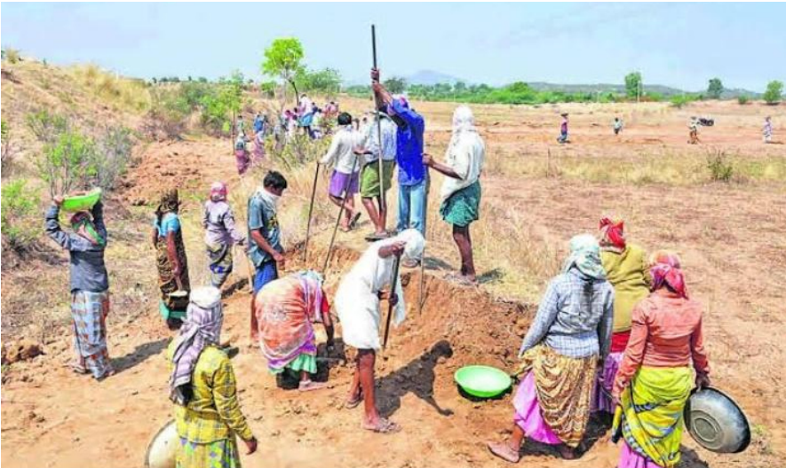
అనంతగిరి.మే 1 (ప్రజావినికెడి):

జాతీయ గ్రామీణ ఉపాధి హామీ పథకం కింద అనంతగిరి మండలంలో కొనసాగుతున్న పనుల వద్ద ఆరోగ్య సిబ్బందిని ఏర్పాటు చేయాలని కూలీలు కోరుతున్నారు. మండలం వద్ద ఎండల్లో వృద్ధులు, వికలాంగులు, వితంతువులు సహా పలువురు కూలీలు పనులకు వెళ్తుండగా అనారోగ్య సమస్యలు తలెత్తుతున్నాయని ఆవేదన వ్యక్తం చేస్తున్నారు. ప్రత్యేకించి బీబీ, షుగర్ వంటి వ్యాధులతో బాధపడుతున్న కూలీలు ఎండ తీవ్రత కారణంగా అస్వస్థతకు గురయ్యే ప్రమాదం ఉందని తెలిపారు. ఇలాంటి సమయంలో పని ప్రదేశంలోనే ఆరోగ్య సిబ్బంది అందుబాటులో ఉంటే తక్షణ చికిత్స అందించి ప్రమాదాల నుంచి రక్షించవచ్చని వారు అభిప్రాయపడుతున్నారు. పని సమయంలో ఎవరైనా కూలి అస్వస్థతకు గురైతే సమీపంలో వైద్య సహాయం అందక ఇబ్బందులు పడాల్సి వస్తోందని చెప్పారు. కనీసం ప్రతి రోజు ఒక ఆరోగ్య సిబ్బంది, ప్రాథమిక మెడికల్ కిట్, ఓఆర్ఎస్ ప్యాకెట్లు అందుబాటులో ఉంచాలని కూలీలు డిమాండ్ చేస్తున్నారు. ప్రభుత్వం చేసేవి కాలంలో కూలీల రక్షణ కోసం పలు సూచనలు చేసినప్పటికీ, వాటి అమలు పూర్తిస్థాయిలో జరగడం లేదని పేర్కొన్నారు. కూలీల ప్రాణ భద్రతను దృష్టిలో ఉంచుకుని పని ప్రదేశాల్లో తక్షణమే ప్రతి రోజు ఆరోగ్య సిబ్బందిని నియమించాలని కోరుతున్నారు. ఎండల తీవ్రత రోజురోజుకూ పెరుగుతున్న నేపథ్యంలో ఆరోగ్యశాఖ అధికారులు స్పందించి కూలీల ఆరోగ్య పరిరక్షణకు అవసరమైన చర్యలు తీసుకోవాలని వారు విజ్ఞప్తి చేస్తున్నారు.