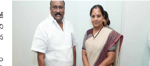
వెల్లడించారు. ఈ సందర్భంగా ఆయన మాట్లాడుతూ.. సింగరేణి బొగ్గు గనుల ప్రాంతంలో తెలంగాణ రక్షణ సేనను బలోపేతం చేయడానికి, పార్టీ విస్తరణకు తన వంతు కృషి చేస్తానని