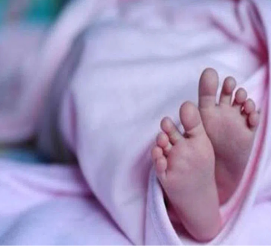
బాలుడిపై మైనర్ అత్యాచారానికి పాల్పడ్డాడు. అయితే, విషయం ఎవరికైనా తెలిస్తే ఇబ్బంది

మహారాష్ట్ర : మహారాష్ట్రలోని పూనేలో దారుణం జరిగింది. మూడేళ్ల బాలుడిపై మైనర్ హత్యాచారానికి పాల్పడ్డాడు. బాలుడిపై అత్యాచారం చేసిన అనంతరం నిందితుడు, చిన్నారిని చంపేశాడు. ఈ ఘటన మే 1, శుక్రవారం చంపేశాడు. పూనే పరిధిలో ఒక రోజు జరిగిన రెండో చిన్నారి హత్యాచారం ఘటన ఇది. బాలుడి హత్యాచారానికి సంబంధించి పోలీసులు తెలిపిన వివరాలివి. పూనేలో ఉంటున్న ఒక కుటుంబానికి చెందిన మూడేళ్ల బాలుడిని, శుక్రవారం వారి ఇంటికి దగ్గరలో ఉండే బిహారీకు చెందిన ఒక మైనర్ తీసుకెళ్లారు. చాక్లెట్లు ఇస్తానని చెప్పి సమ్మించి, బాలుడిని తన నివాసం ఉండే ఇంటికి తీసుకెళ్లారు. అక్కడ