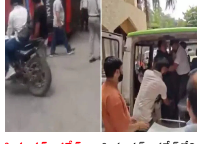
హిమాచల్ ప్రదేశ్ : హిమాచల్ ప్రదేశ్ లోని కంగ్రాలో ఆదివారం బస్సు ప్రమాదం జరిగింది. బస్సు బోల్తా పడిన ఘటనలో 26 మంది ప్రయాణికులు గాయ పడ్డారు. ఈ

ఘటన ఉత్తర ప్రదేశ్ లోని కంగ్రా జిల్లాలో జరిగింది. ఒక ప్రైవేటు ట్రావెల్స్ బస్సు 40 మంది ప్రయాణికులతో చంబా నుంచి ఉనా వెళ్తోంది. ఈ క్రమంలో సురూర్ సమీపంలోని నియాజ్ పూర్ వద్ద బస్సు బోల్తా పడింది. ఈ ఘటనలో బస్సులోని ప్రయాణికుల్లో 26 మందికి పైగా గాయపడ్డట్లు తెలుస్తోంది. బస్సు డ్రైవర్ గుండె పోటుకు గురికావడం, ఈ సమయంలో బస్సును నియంత్రించలేకపోవడం వల్లే బోల్తాపడి ఈ ప్రమాదం జరిగిందని ప్రాథమిక అంచనా. బస్సు అదుపుతప్పింపుతున్న సమయంలోనే కొందరు ప్రయాణికులు గమనించి తమను తాము రక్షించుకునేందుకు