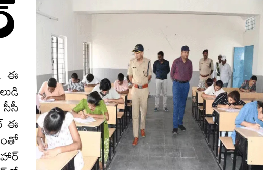
న్యూఢిల్లీ : దేశవ్యాప్తంగా మెడిసిన్ కోర్సుల్లో ప్రవేశాల కోసం నిర్వహించిన నీట్ యూజ్ -- 2026 పరీక్ష ప్రశాంతంగా ముగిసింది. నేషనల్ టెస్టింగ్ ఏజెన్సీ ఆధ్వర్యంలో ఈరోజు మధ్యాహ్నం రెండు గంటలకు ప్రారంభమైన ఈ పరీక్ష సాయంత్రం 5 గంటలకు ముగిసింది. ఈ ఏడాది దేశ వ్యాప్తంగా 552 నగరాలు, 14

అంతర్జాతీయ కేంద్రాల్లో కలిపి సుమారు 20 లక్షల మందికి పైగా విద్యార్థులు నీట్ పరీక్షకు హాజరు య్యారు. పరీక్ష నిర్వహణ కోసం ఎన్ టీ వి కట్టడి బృందం ఏర్పాటు చేసింది. విద్యార్థులను ఉదయం 11 గంటల నుంచే పరీక్షా కేంద్రాల్లోకి అనుమతించారు. మధ్యాహ్నం 1.30 గంటలకు గేట్లు మూసివేసి ఆ తర్వాత వచ్చిన వారిని లోపలికి అనుమతించలేదు. పరీక్ష కేంద్రాల వద్ద డ్రైన్ కోడ్ తోపాటు ఇతర నిబంధనలను కఠినంగా అమలు చేశారు. అడ్మిట్ కార్డు, ఫోటో, ప్రభుత్వ గుర్తింపు కార్డు ఉన్నవారిని క్లుప్తంగా తనిఖీ చేసి లోపలికి పంపించారు. విద్యార్థులకు 1.45 గంటలకు ప్రశ్నపత్రాలు, ఓఎంఆర్ షీట్లు అందజేసి, రెండు గంటలకు పరీక్ష ప్రారంభించారు. పరీక్ష ప్రశాంతంగా ముగియడంతో విద్యార్థులు, వారి తల్లిదండ్రులు ఊరికి వెళ్లుతున్నారు.