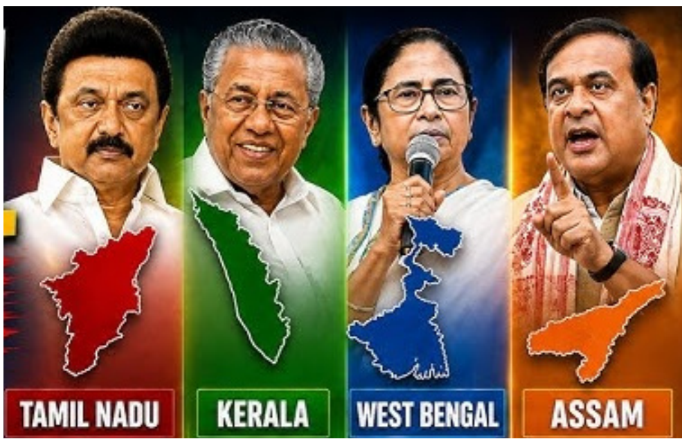
TAMIL NADU KERALA WEST BENGAL ASSAM