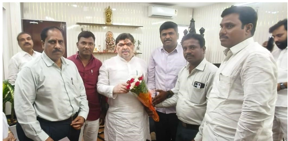
షాద్ నగర్, ప్రజావినికెడి:

షాద్ నగర్ పట్టణానికే అకాడమీ తలమానికంగా నిలుస్తుంది - అకాడమీ కి ప్రభుత్వం అండగా ఉంటుంది