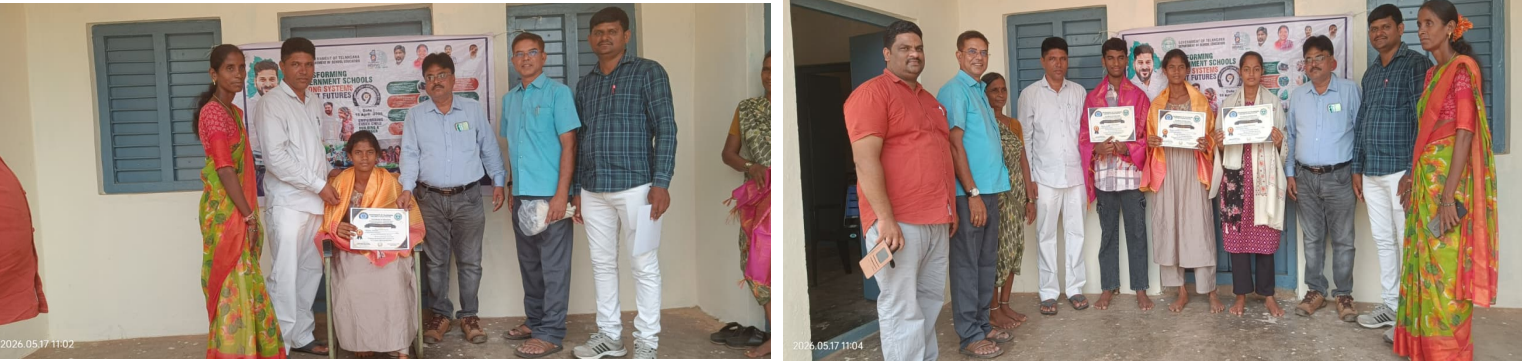
వాజేడు, మే 18, ప్రజావినికడి:

10వ తరగతిలో ఉత్తమ ప్రతిభ కనబరిచిన విద్యార్థులకు సన్మానం