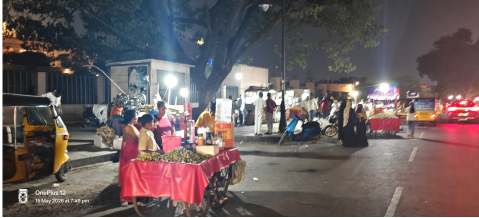
ఫుట్ పాత్ లు ప్రజల కోసమా, వ్యాపారుల కోసమా.?

వ్యాపారుల అడ్డాగా మారిన, సెక్రటేరియట్, హుస్సేన్ సాగర్ పరిసరాలు.. ట్రాఫిక్ పోలీసుల, హెచ్ఎండిపి అధికారుల నిర్లక్ష్యం.. ప్రజలకు నరకం.. కొన్ని సంవత్సరాలుగా పాతుకుపోయిన ఫుట్ పాత్ వ్యాపారులు.. హెచ్ఎండిపి ట్రాఫిక్ పోలీసుల పూర్తి బాధ్యతారాహిత్యం.. హుస్సేన్ సాగర్ పరిసరాల అభివృద్ధి కోసం కోట్లు ఖర్చు గాలితేనా.. ఫుట్ పాత్ వ్యాపారులతో రహదారులు చెత్తమయ్యాయి.. ట్రాఫిక్ పోలీసులు డ్యూటీ చేయడం మానేశారా.? ఉన్నత అధికారులు పర్యవేక్షణ పక్కన పెట్టారా.?