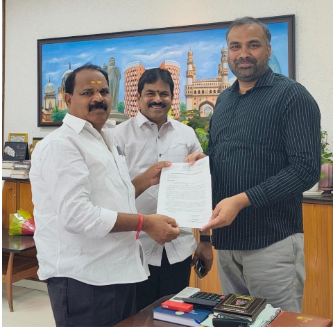
ఇండస్ట్రియల్ పార్క్ ఏర్పడితే ఇక్కడి ప్రజలకు ఉపాధి దొరుకుతుందని భూములు ఇచ్చారు కానీ ఏకో టౌన్