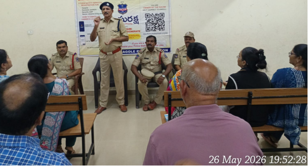
26 May 2026 19:52:28