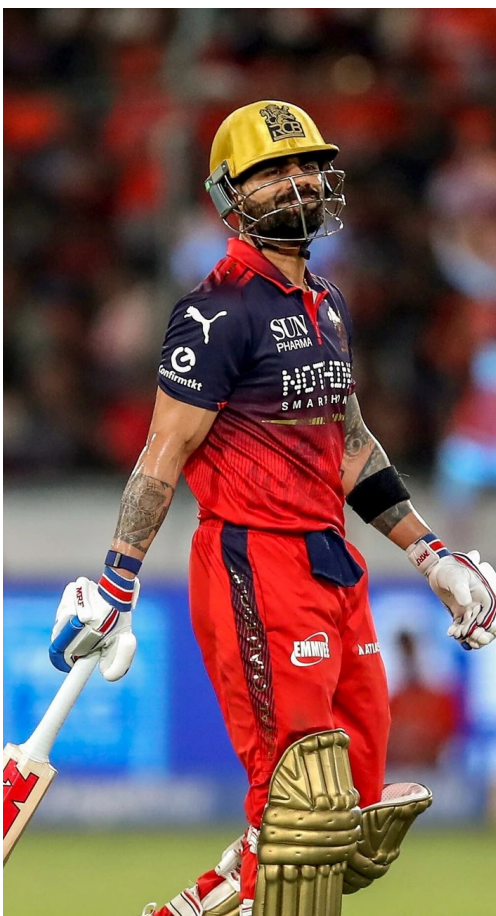
గుజరాత్ కు ఆరంభంలోనే ఎదురుదెబ్బ తగలింది. మూడు ఫోర్లు కొట్టి జోరు చూపించిన, ఆరెంజ్ క్యాప్

డిఫెండింగ్ ఛాంపియన్ రాయల్ చాలెంజర్స్ బెంగళూరు అద్భుతం చేసింది. ఈ సీజన్లో తొలిసారి ప్లే ఆఫ్స్ కు చేరిన జట్టుగా నిలిచిన ఆర్సీబీ.. తన రికార్డును నిలబెట్టుకుంటూ, ఫైనల్లోకి కూడా ప్రవేశించింది. ధర్మశాలలో మంగళవారం జరిగిన క్వాలిఫయర్ -1లో మాజీ ఛాంపియన్ గుజరాత్ టైటాన్స్ పై 92 పరుగులతో ఘన విజయం సాధించి, వరుసగా రెండోసారి ఫైనల్లోకి ప్రవేశించింది. అంతకుముందు టాప్ ఓడి ఫస్ట్ బ్యాటింగ్ చేసిన ఆర్సీబీ నిర్ణీత 20 ఓవర్లలో ఆర్సీబీ 5 వికెట్లు 254 పరుగుల భారీ స్కోరు సాధించింది. క్వాలిఫయర్ మ్యాచ్ లో ఇదే అత్యధిక స్కోరు కావడం విశేషం. రజత్ పటిదార్ కెప్టెన్ ఇన్నింగ్స్ (33 బంతుల్లో 93 నాటౌట్, 5 ఫోర్లు, 9 సిక్సర్లు) తో టాప్ స్కోరర్ గా నిలిచాడు. జాసన్ హోల్డర్, కగిసో రబాడ కు రెండేసి వికెట్లు దక్కాయి. అనంతరం చేజింగ్ లో 19.3 ఓవర్లలో గుజరాత్ కేవలం 162 పరుగులకే ఆలోబైంది. ఫినిషర్ రాహుల్ తెవాటియా సూపర్ షిఫ్ట్ (43 బంతుల్లో 68, 8 ఫోర్లు, 4 సిక్సర్లు) తో టాప్ స్కోరర్ గా నిలిచి, ఓటరి పోరాటం చేశాడు బొలర్లలో జేకబ్ డఫ్టీ మూడు వికెట్లతో రాణించాడు. ఈ విజయంతో ఆర్సీబీ ఫైనల్ కు వెళ్లగా, జీటీ, క్వాలిఫయర్ 2కి పదిపోయింది. బుధవారం సన్ రైజర్స్ హైదరాబాద్ తో జరిగే మ్యాచ్ లో రాజస్థాన్ రాయల్స్ తలపడనుంది. ఈ మ్యాచ్ విజేతతో జీటీ తలపడనుంది. ఇందులో గెలిచిన జట్టుతో ఫైనల్లో ఆర్సీబీ తలపడనుంది. ఛార్ బెర్నార్డ్ తో బరిలోకి దిగిన