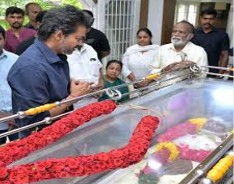
హామీ ఇచ్చారు. ఈ నిర్ణయం పట్ల నిర్మాతల సంఘం హర్షం వ్యక్తం చేసింది. ఈ సందర్భంగా టీఎఫ్ఏపీఏ ఒక పత్రికా ప్రకటన విడుదల చేసింది. భారతీయ చలనచిత్ర రంగంలో విప్లవాత్మక మార్పులు తీసుకొచ్చిన దర్శకుడిగా భారతీరాజు అని కొనియాడింది. ఒక దర్శకుడిగా ఎన్నో అద్భుతమైన చిత్రాలను రూపొందించడమే కాకుండా, నటుడిగానూ తనదైన ముద్ర వేసి ప్రేక్షకుల హృదయాలను గెలుచుకున్నారని ప్రశంసించింది. కేంద్ర ప్రభుత్వం నుంచి పద్మశ్రీ (2004) పురస్కారంతో పాటు 6 జాతీయ చలనచిత్ర అవార్డులు, 6 తమిళనాడు రాష్ట్ర చలనచిత్ర అవార్డులు అందుకొని సినిమాకు గర్వకారణంగా నిలిచారని గుర్తుచేసింది. 2020లో నిర్మాతల సంక్షేమం కోసం భారతీరాజు ముందుండి 'తమిళ ఫిల్మ్ యాక్టివ్స్ ప్రొడ్యూసర్స్ అసోసియేషన్'ను స్థాపించారని, ఆయన నాయకత్వ పటిమతోనే ఈ సంఘం నేడు 400 మందికి పైగా క్రియాశీల నిర్మాతలతో బలంగా ఉందని అసోసియేషన్ తెలిపింది. నిర్మాతలు, దర్శకులు, నటీనటుల సంక్షేమం కోసం ఆయన నిరంతరం తపించారని, తమిళ సినిమా అభివృద్ధికి అంతీకభావంతో పనిచేసారని కృతజ్ఞతాపూర్వకంగా స్మరించుకుంది.

దిగ్గజ చలనచిత్ర దర్శకుడు భారతీరాజు అంత్యక్రియలను ప్రభుత్వ అధికారిక లాంఛనాలతో నిర్వహించనున్నట్లు తమిళనాడు ముఖ్యమంత్రి సి. జోసెఫ్ విజయ్ ప్రకటించారు. తమిళ చిత్ర పరిశ్రమకు ఆయన అందించిన అసమాన సేవలకు, ఆయన స్థాయికి గుర్తింపుగా ఈ నిర్ణయం తీసుకున్నట్లు ప్రభుత్వం వెల్లడించింది. భారతీరాజుకు అధికారిక లాంఛనాలతో తుది వీడ్కోలు పలకాలంటూ తమిళ ఫిల్మ్ యాక్టివ్స్ ప్రొడ్యూసర్స్ అసోసియేషన్ (టీఎఫ్ఏపీఏ) చేసిన విజ్ఞప్తికి ప్రభుత్వం సానుకూలంగా స్పందించింది. అంతకుముందు టీఎఫ్ఏపీఏ ముఖ్యమంత్రికి ఒక విజ్ఞప్తి చేస్తూ, తమ వ్యవస్థాపకుడైన భారతీరాజుకు ప్రభుత్వ గౌరవం కల్పించాలని కోరింది. దీనిపై వెంటనే స్పందించిన సీఎం విజయ్, ప్రభుత్వ గౌరవ వందనతో ఆయన అంత్యక్రియలు జరుగుతాయని