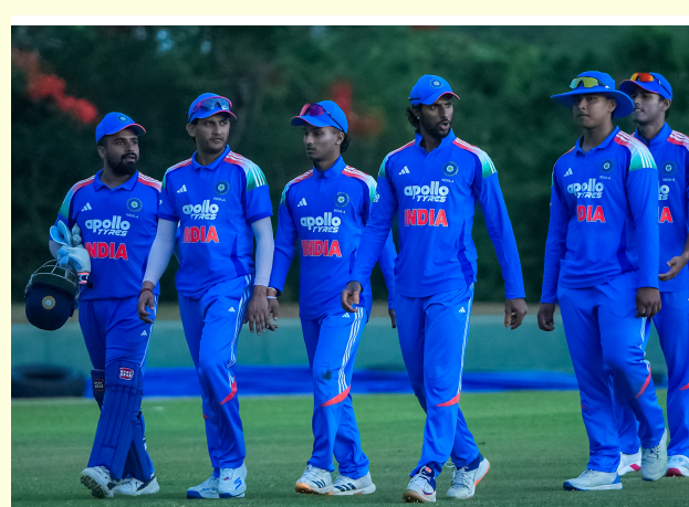
డీఎల్ఎస్ పద్ధతిలో అప్డేట్స్ ఏ విజయం సాధించింది. అప్డేట్స్ జట్టులో ఇప్డేట్స్ మీర్ (75లి పరుగులు), బిషిర్ షా (51లి పరుగులు) హాఫ్ సెంచరీలతో రాణించారు. భారత్ బౌల్డర్లలో

2026 ట్రె సిరీస్లో యువ భారత్కు షాక్ తగిలింది. దంబల్ వేదికగా జరిగిన రెండో మ్యాచ్లో భారత్- ఏపై అప్డేట్స్- ఏ డక్వర్ట్ లూయిస్ పద్ధతిలో 4 పరుగుల తేడాతో నెగ్గింది. మ్యాచ్కు వర్షం అంతరాయం కలిగించడంతో తొలుత ఆటను 49 ఓవర్లకు కుదించారు. మొదట బ్యాటింగ్ చేసిన టీమ్ ఇండియా 349-9 భారీ స్కోర్ చేసింది. అనంతరం మరోసారి వర్షం ఆటకు అంతరాయం కలిగించింది. దీంతో అప్డేట్స్ టూర్నెంట్ను 38 ఓవర్లలో 294గా నిర్ణయించారు. అయితే రెండో ఇన్నింగ్స్లో అప్డేట్స్ 25.5 ఓవర్లకు 177-2 వద్ద ఉన్న సమయంలో మళ్లీ వర్షం కురిసి మళ్లీ ఆట ఆగిపోయింది. డక్వర్ట్ లూయిస్ ప్రకారం అప్పటికి అప్డేట్స్ నాలుగు పరుగుల ముందంజలో ఉంది. దీంతో