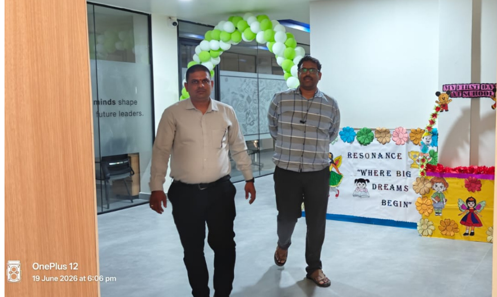
OnePlus 12 19 June 2026 at 6:06 pm

మరోవైపు, ఈ అంశాన్ని వెలుగులోకి తీసుకురావడానికి ప్రయత్నిస్తున్న కొందరు రిపోర్టర్లు, సామాజిక కార్యకర్తలపై పాఠశాల యాజమాన్యం ఒత్తిళ్లు, బెదిరింపులకు పాల్పడుతోందనే ఆరోపణలు కూడా వినిపిస్తున్నాయి. ప్రజాస్వామ్య వ్యవస్థలో అవినీతి, అక్రమాలు లేదా ప్రజా