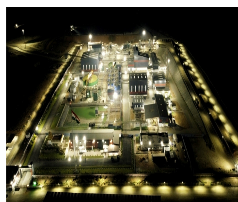
శంకుస్థాపన చేయనున్నారు. జియో మైసూర్ సర్వీసెస్ ఇండియా ప్రైవేట్ లిమిటెడ్, డెక్కన్ గోల్డ్ మైన్స్ లిమిటెడ్ సంస్థలు రూ.405 కోట్ల పెట్టుబడితో బంగారు నిక్షేపాలు వెలికితీసే ఈ కర్మాగారాన్ని నెలకొల్పాయి. ఇందుకు అవసరమైన నీటి కోసం హంద్రీపా నుజల ప్రపంతి ద్వారా 18 కి.మీ. పైపులైన్ తో 0.021 టీఎంసీలను వినియోగించనున్నారు. ఈ మేరకు రేపు సీఎం

ప్రస్తుతం ఏర్పాటైన ఈ ఫ్లాంట్ ద్వారా తొలి ఏడాదికి 400 కిలోల పసిడిని ఉత్పత్తి చేయనున్నారు. వచ్చే ఏడాది నుంచి 900 కిలోల బంగారం ఉత్పత్తి చేస్తారు. ఈ రకంగా ఏ ఏడాదికి ఆ ఏడాది ఉత్పత్తి పెరుగుతూ... ఏడాదికి 2 టన్నుల వరకు బంగారం ఉత్పత్తి చేయనున్నారు. ఈ మేరకు ఫ్లాంట్ సామర్థ్యాన్ని ప్రాసెసింగ్ కెపాసిటీని విస్తరించనున్నారు. ఈ ఫ్లాంట్ ద్వారా 700 మందికి ఉపాధి లభిస్తుంది. ఇక ఉత్పత్తి చేసిన బంగారం ధరలో 4 శాతం రాష్ట్రానికి రాయల్టీగా వస్తుంది. మొదట తీసే 400 కేజీలకు రూ.57 కోట్లు, 900 కేజీలకు రూ.144 కోట్ల వరకూ రాయల్టీ రూపంలో ప్రభుత్వానికి ఆదాయం రానుంది.