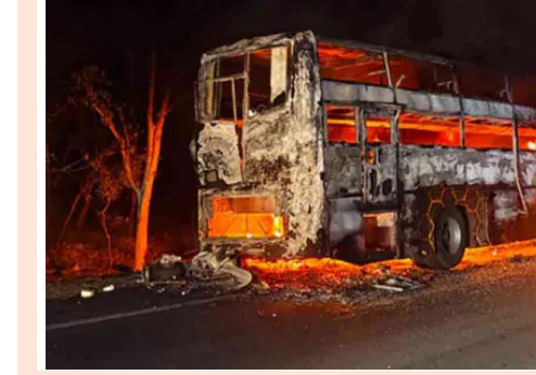
సల్గొండ జిల్లా,మే 30(ప్రజావినికీడి):సల్గొండ జిల్లాలో ఓ ప్రైవేటు బస్సు దగ్ధమైంది. చిల్కాల్ మండలం పెద్ద కాపర్తి గ్రామ శివారులో హైదరాబాద్-విజయవాడ ప్రధాన రహదారిపై ఓ ప్రైవేటు ట్రావెల్స్ బస్సులో అకస్మాత్తుగా మంటలు చెలరేగాయి. ఇది

గమనించిన డ్రైవర్ వెంటనే బస్సును పక్కకు ఆపి, ప్రయాణికులను అప్రమత్తం చేశారు.దీంతో బస్సులోని 36 మంది ప్రయాణికులు సురక్షితంగా బయటపడ్డారు. అయితే లగ్జరీ మొత్తం కాళిపోయింది. షార్ప్ సర్కూల్ కారణంగానే ప్రమాదం జరిగినట్లు తెలుస్తోంది.