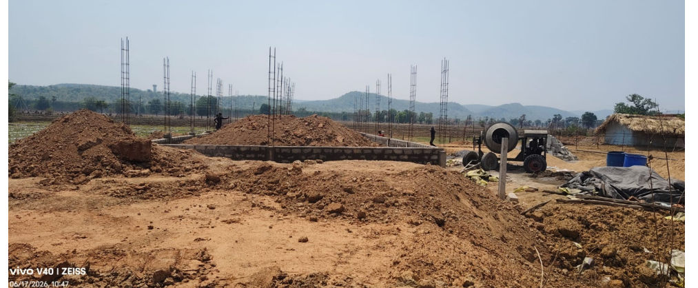
ఏజెన్సీలో అక్రమ నిర్మాణాలు

అదివాసి భూములు గిరిజనేతరుల పరం.. -అక్రమ నిర్మాణాలు చేపడుతున్నా పట్టించుకోని అధికారులు..