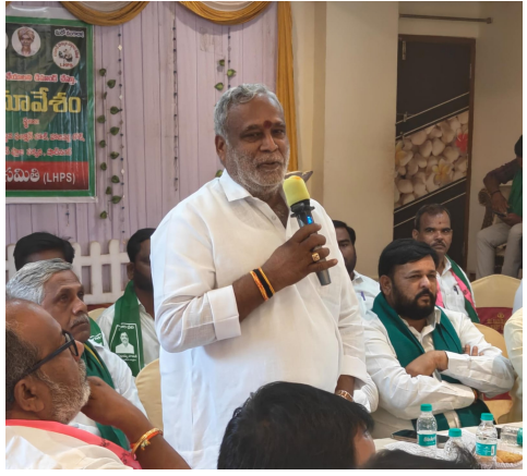
షాద్ నగర్, ప్రజావినికిడి:

డంపింగ్ యార్డును అడ్డుకునేందుకు సమిష్టి పోరాటానికి పిలుపు.. - షాద్ నగర్ లో ఎల్ హెచ్ పీఎస్ ఆధ్వర్యంలో రౌండ్ టేబుల్ సమావేశం..