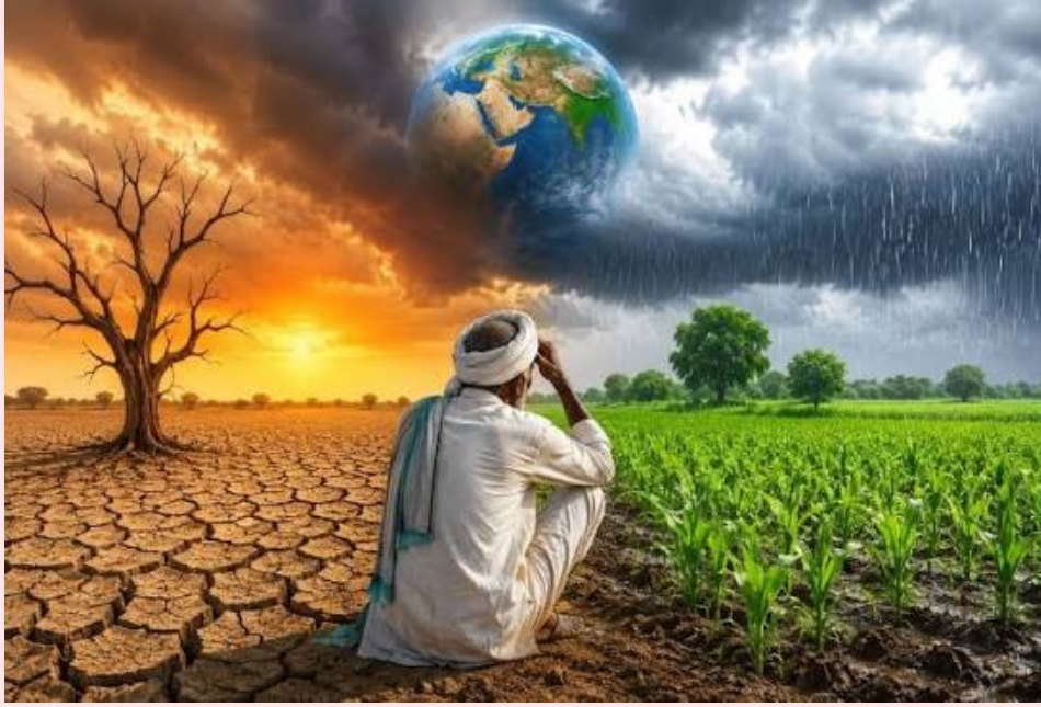
అందకపోవడంతో పంటల దిగుబడిపై తీవ్ర ప్రభావం వడుతోంది. నేడు వ్యవసాయం అత్యంత ఖరీదైన వ్యవహారంగా మారింది. కూలీల ఖర్చులు, ట్రాక్టర్ల అద్దెలు, డీజిల్ ధరలు, విత్తనాలు, ఎరువుల ధరలు ఆకాశస్పృంహితులున్నాయి. పెట్టుబడి రెట్టించుకున్నా దానికి తగ్గట్టుగా పంటకు మద్దతుధర లభించడం లేదు. మార్కెట్లో డకారుల వ్యవస్థ, సిండికేట్లుగా మారిన వ్యాపారులు రైతు

కోలుకోలేని దెబ్బతగులుతోంది. ఎల్ఐసీ తట్టుకునేలా రైతులకు అత్యవసర సాయానికి ప్రభుత్వాలు రంగంలోకి దిగాలి. ఇకపోతే వ్యవసాయంలో పెట్టు బడులు రోజురోజుకూ పెరుగుతున్నాయి. విత్తనాలు, ఎరువులు, పురుగుమందులు, కూలీల ఖర్చులు భారీగా పెరిగాయి. పంటదిగుబడి ఆశించిన స్థాయిలో రాకపోవడం, మార్కెట్ గిట్టుబాటు ధరలు లేకపోవడంతో రైతు పెట్టిన పెట్టుబడులు కూడా తిరిగి రావడం లేదు. దీంతో అప్పులు చేయడం తప్ప రైతుకు మరో మార్గం కనిపించడం లేదు. పండించిన పంటలకు గిట్టుబాటు ధరలు రావడం లేదు. ధాన్యం కొంటారన్న గ్యారంటీ లేదు. దీనితోనూ నకిలీ విత్తనాల సమస్య రైతులను తీవ్రంగా వేధిస్తోంది. అధిక దిగుబడి వస్తుందని నమ్మించి విక్రయించే నకిలీ విత్తనాల వల్ల మొలక శాతం తగ్గిపోవడం, పంటలు దెబ్బతినడంతో రైతుకు కుదేలవుతున్నాయి. మరోవైపు ఎరువుల కొరత రైతులకు తలసాప్పిగా మారింది. సీజన్ సమయంలో ఎరువుల కొరత నుండి తరబడి క్యూలలో నిలబడాలన్న పరిస్థితి ఏర్పడుతోంది. అవసరమైన సమయంలో ఎరువులు