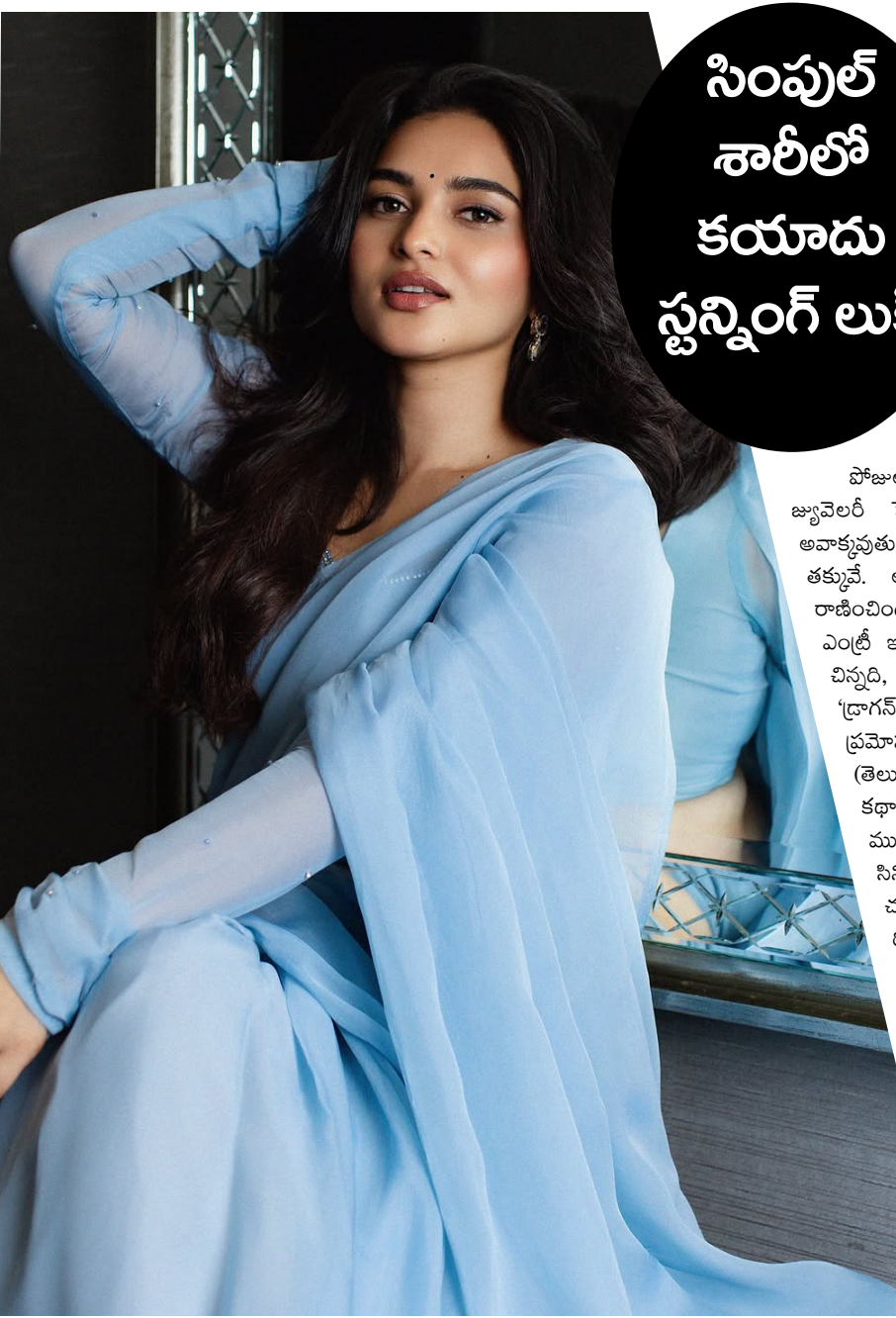
సింపుల్ శాటిలో కయాడు స్టన్నింగ్ లుక్